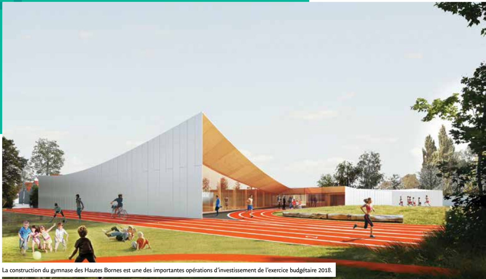
La construction du gymnase des Hautes Bornes est une des importantes opérations d'investissement de l'exercice budgétaire 2018.