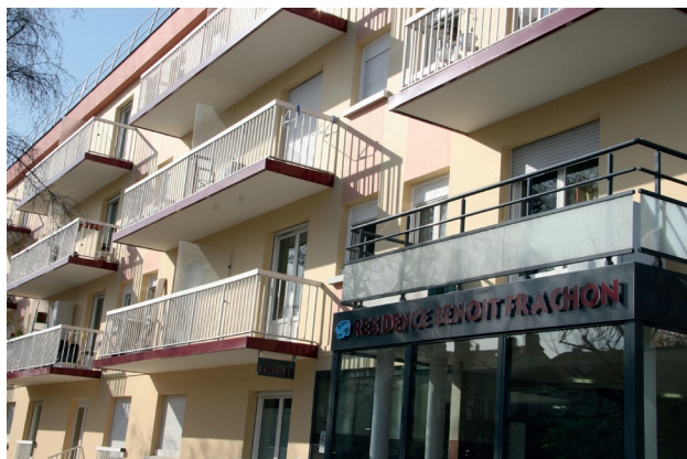
RÉSIDENCE BENOÎT FRACHON, 31 BD DES ALLIÉS