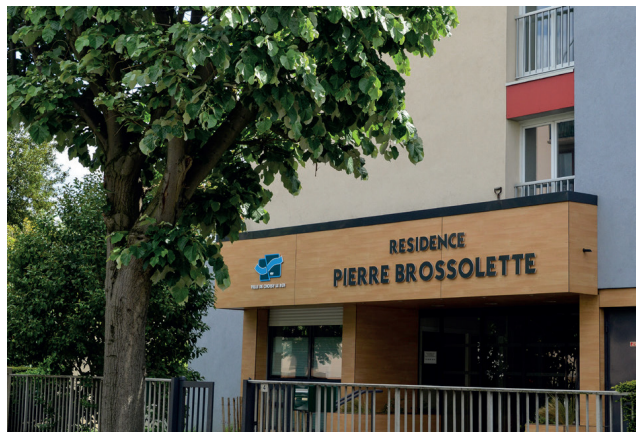
RÉSIDENCE PIERRE BROSSETTE, 4 AV. DE LA FOLIE