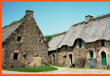
Les chaumières de Poul-Fetan

La matinée : Départ vers le village de Poul-Fetan à Quistinic pour une immersion dans un village de chaumières entièrement restauré, retraçant la vie quotidienne des paysans bretons au 19 e siècle.