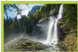
Cascade du Rouget