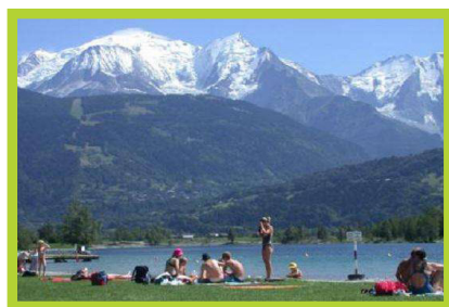
Lac de Passy