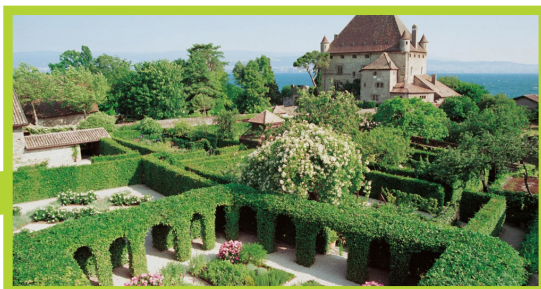
Jardin remarquable des cinq sens