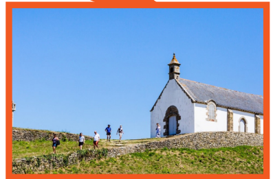
Tumulus de Saint-Michel