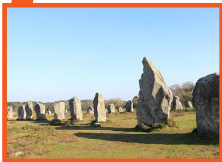
Alignement de Menhirs

• La matinée : Découverte des célèbres alignements de Menhirs. Visite commentée des sites: Cromlech, alignement du Ménéac, de Kermario et de Kerlecan. Escale sur le port de la Trinité-sur-Mer.