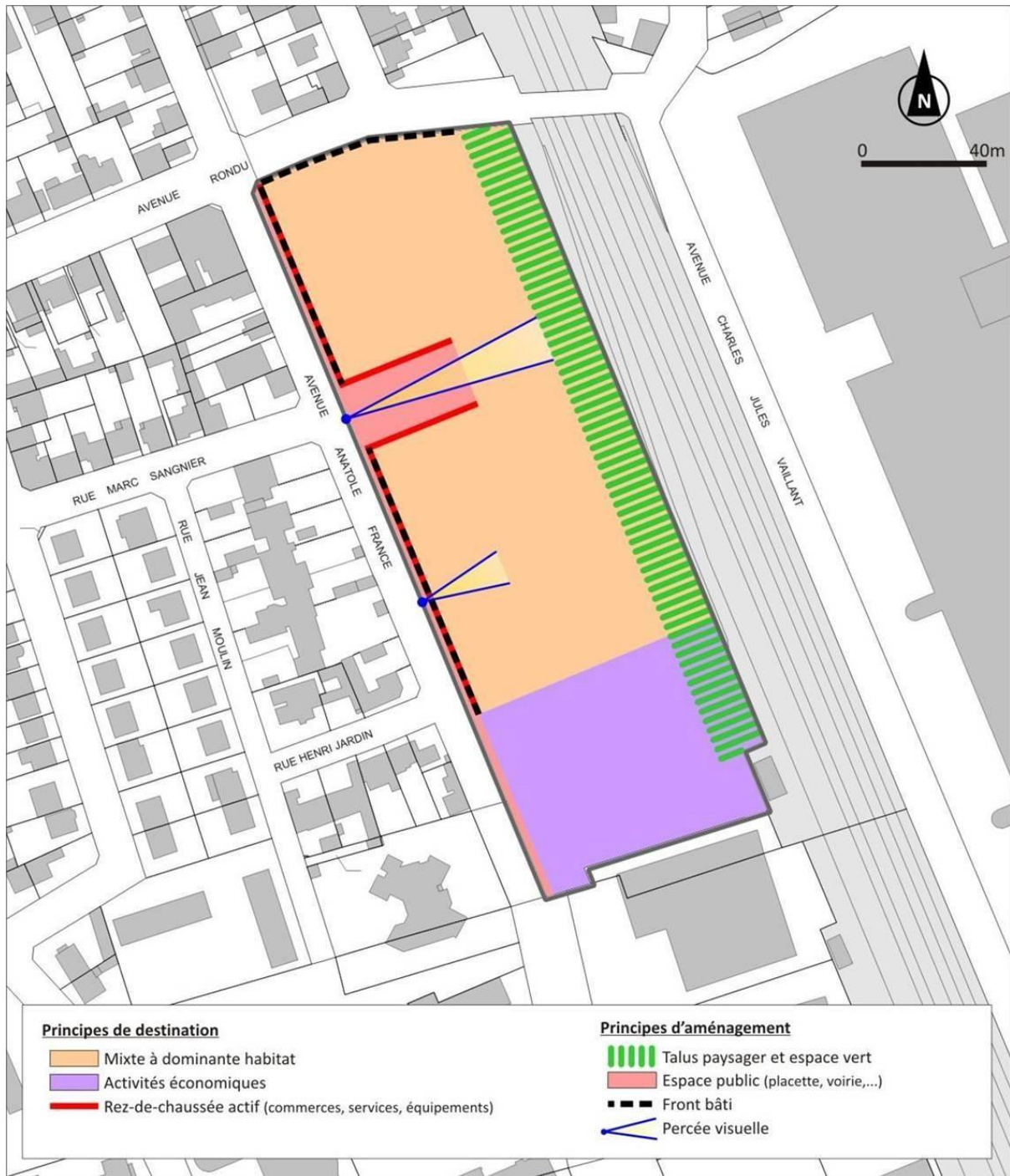
Schéma des orientations d'aménagement et de programmation pour le secteur Fonderie Fine