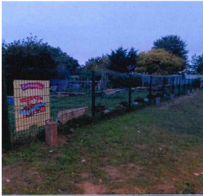
Photographie du jardin partagé en date du 26/09/2025