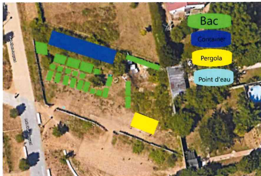
Plan du jardin partagé