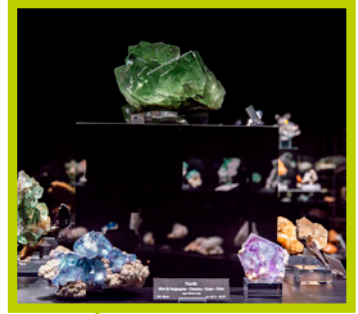
Musée des Cristaux