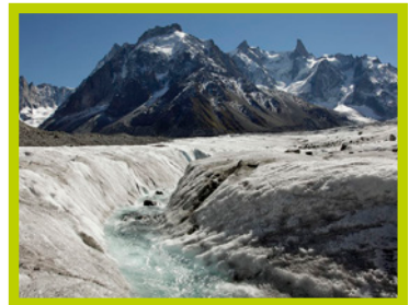
La Mer de Glace