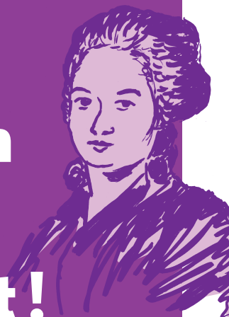
Olympe de Gouges